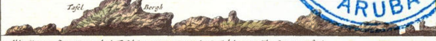
Aldus vertoont CURACAO als de Tafel Berg W.N.W. van u is 't 3. Myl. heesien Klein CURACAO sijnde.